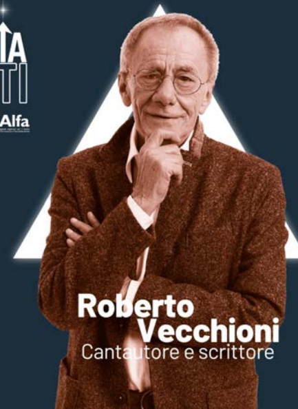
Roberto Vecchioni Cantautore e scrittore